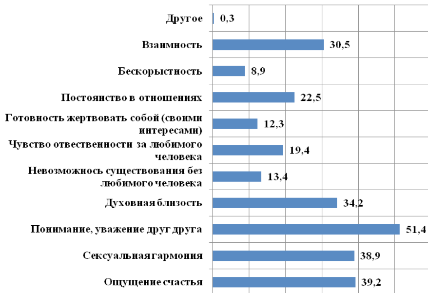
Рисунок 1. Представления респондентов о сущности любви (в % от опрошенных, n=2000)

Для иллюстрации влияния демографических, экономических, социально-статусных и иных факторов на формирование и развития такого свойства как способность любить можно привести, например, данные, полученные специалистами «ФОМ» (еженедельный опрос «ФОМнибус» 9-10 февраля 2013 г. 43 субъекта РФ, 100 населенных пунктов, n=1500), (см. Табл.1) и результаты исследования (при участии автора) «Мониторинг социальной сферы России 2005 г.» (% субъектов РФ по репрезентативной выборке, n=2918), (см. Табл.2, 3).